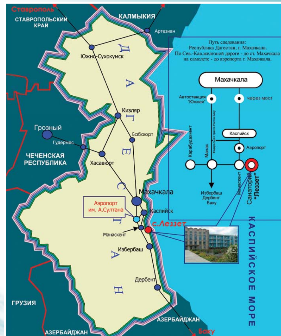
Схема расположения санатория «Леззет» и маршруты проезда